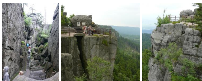
Hejšovina – Szcelandiec