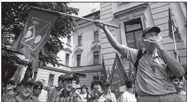
Stávka v úterý ovládne celou zemi.

• Vláda reformou způsobila reálné snížení platů ve školství, zdravotnictví a veřejné správě, stávka je i za spravedlivé navýšení platů zaměstnanců v rozpočtové a příspěvkové sféře a službách.