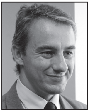
Předseda OS KOVO Josef Středula

Potřeba podpořit stávku je zejména v tom, že kroky, které se chystají, uškodí zejména zaměstnancům, tedy středně a nízkopříjmovým lidem. Jednak je to nebezpečná věc týkající se reformy zdravotnictví a snaha přenést veškerou odpovědnost na pacienta bez ohledu na to, že řádně platí zdravotní pojištění. Dále je to snížení dostupnosti péče. Dalším důvodem je obrovská dražota, která ze dvou třetin vznikla vlivem špatné a špatně načasované reformy veřejných financí. To jsou zásadní důvody, proč podpořit stávku a jsem velmi rád, že zaměstnanci